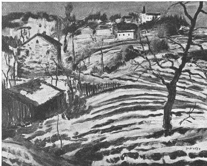
Oesterreichische Ausstellung in der Kunsthalle Bern Ernst Huber Schneeschmelze

Was hier am Beispiel unseres Kunsthauses bemängelt worden ist, sind zum grossen Teil allgemeine Unzulänglichkeiten des heutigen Museumsbetriebes. Vielleicht könnte es zur Anregung dienen, einmal da und dort eigene und neue Wege zu suchen. Kurt Sponagel