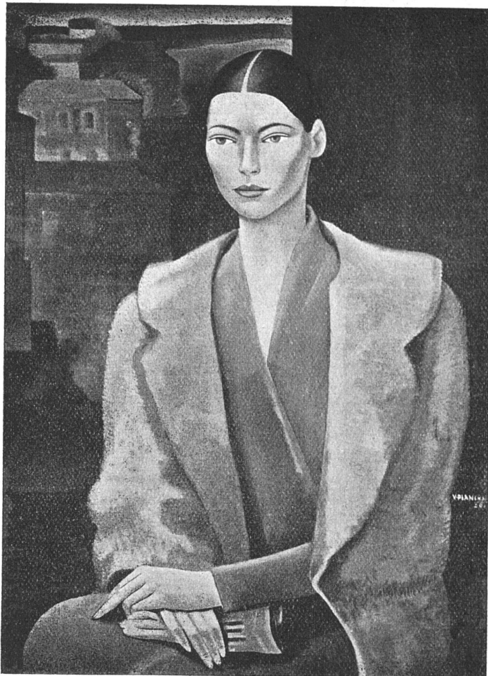
Franz Wiegele Dame in Grün

Leistung; doch übersteigert der Künstler sich leicht und seine Werke verlieren dadurch die Selbstverständlichkeit des guten Kunstwerkes.