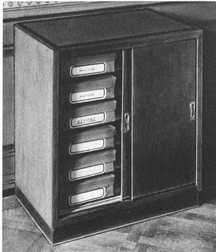
Kombinierbares Schiebetürkästchen für Kartotheken oder Hefte. Erle hellbraun gebeizt und mattiert. Blatt dunkelgraus Linoleum