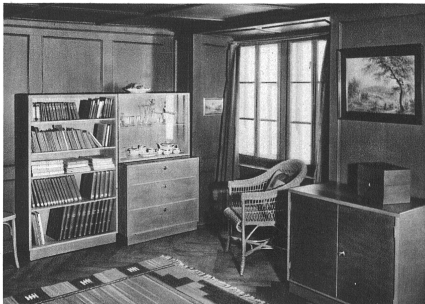
F. Largiadèr, Architekt SWB, Erlenbach-Zürich Kombinierbare Kistenmöbel aus Okumé natur, gewischt. Blatt: Linoleum pompejanischrot Handgewirkter Teppich von Edith Nägeli SWB, Zürich