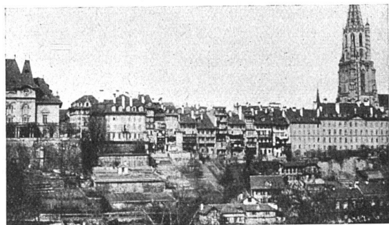
Zwischen Kasino und Stiftsgebäude (Münster) ist das kantonale Verwaltungsgebäude geplant