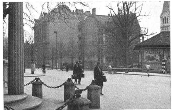
Teilansicht des Geländes für das projektierte Stadthaus an der Bundesgasse; links Widmann-Brunnen

sehbarer Zeit zur Behandlung reif sein, wobei es sich um Städtebauprobleme von weittragender Bedeutung handelt.