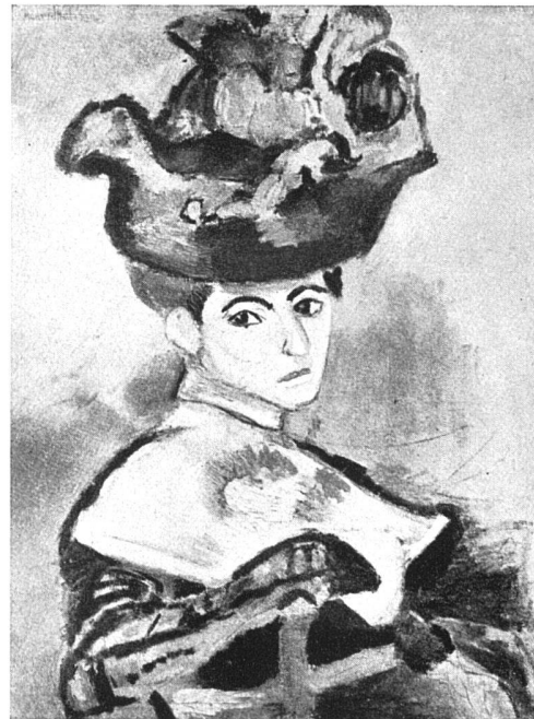
Henri-Matisse Femme au chapeau, 1905