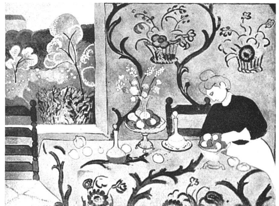
Henri-Matisse La desserte, 1909