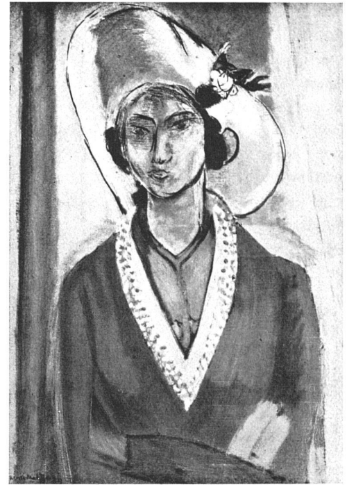
Henri-Matisse Femme au chapeau, 1929

Die Formen sind, um ihnen möglichst geschlossene Wirkung zu wahren, durch dunkle Konturen gegeneinander abgegrenzt, die Farben nicht ineinander verstrichen, sondern als einzelne Töne neben- und übereinander gesetzt. Matisse belebt eine Wand durch andere Mittel als impressionistische Tonigkeit, er überzieht sie tapetenartig mit einem gleichförmigen, fließend aufgestrichenen Muster und löst sie so in einen dekorativen