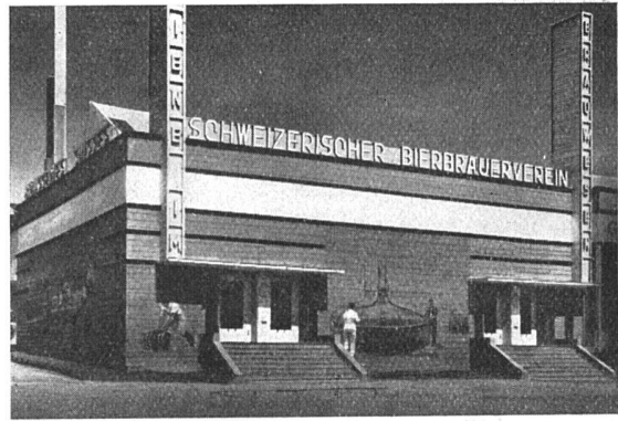
Der Hyspa-Pavillon des Schweiz. Bierbrauervereins von aussen und von innen. An der Fassade Malereien von W. Clénin, Bern. Die ursprüngliche Lichtreklame «TRINKT BIER» wurde nicht auf Initiative der Ausstellungsleitung, sondern erst auf den Protest von Besuchern hin umgeändert in «Hygiene im Brauereiwesen»