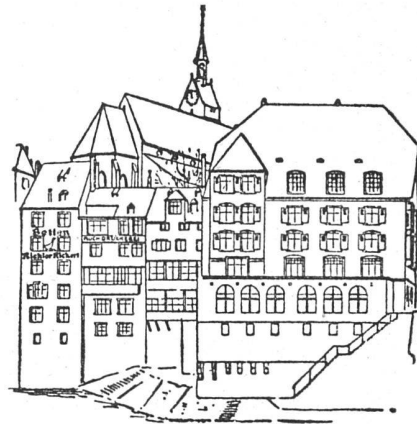
oben: heutiger Zustand; unten: das abgelehnte Neubauprojekt

lichsten Punkte brutal zerstört würde. Wenn man auch im einzelnen heute nicht mehr so bauen würde wie die Con- fiserie Spillmann erbaut wurde, so muss man doch aner- kennen, dass Architekt Fäsch seinerzeit die Baumassen mit untadeligem Gefühl abgewogen hat, und dass hier der Erker links sehr geschickt den Charakter der schma- len, hohen, links anschliessenden Häuser in den Bau- körper des Neubaus aufnimmt, womit vermieden wird, dass dieser zu massig wirkt. Das Neubauprojekt lässt jede derartige Rücksicht vermissen. Wir hoffen, dass die Aktion Erfolg hat, nur wäre wünschenswert, dass die städtebaulichen Bestimmungen für derart ausserordent- liche Situationen von vornherein generell festgesetzt wür- den und nicht erst im «Ernstfall», wo dann jeder der- artige Eingriff für Bauherren wie Architekten notwen- digerweise schikanös wirken muss. Red.