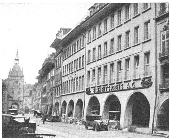
Zwei Neubauten an der Marktgasse, Bern Haus «Epa» von Trachsel und Abbühl, Arch. BSA und Haus Christen von Arch. Gerster, Bern Bauleitung Arch. v. Gunten