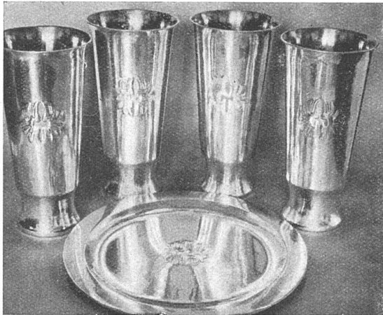
Abendmahlkelche mit Brotteller mit dem Gemeindewappen, Silber Kirche Altikon

Entwurf und Ausführung: Hans Staub, Silberschmied SWB, Zürich