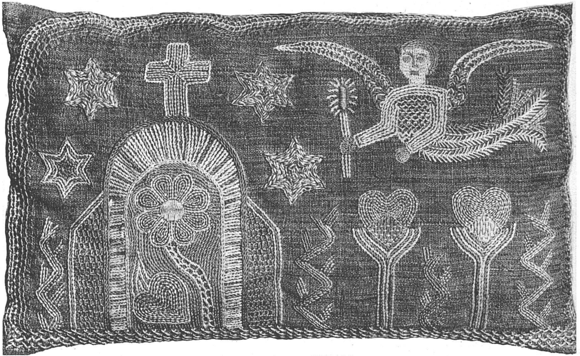
Kissen in Leinstickerei, Weiss und Beige auf Beige, 30×50 cm