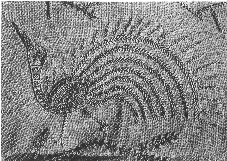
Tier in Leinstickerei aus einer Decke, Beige in Beige