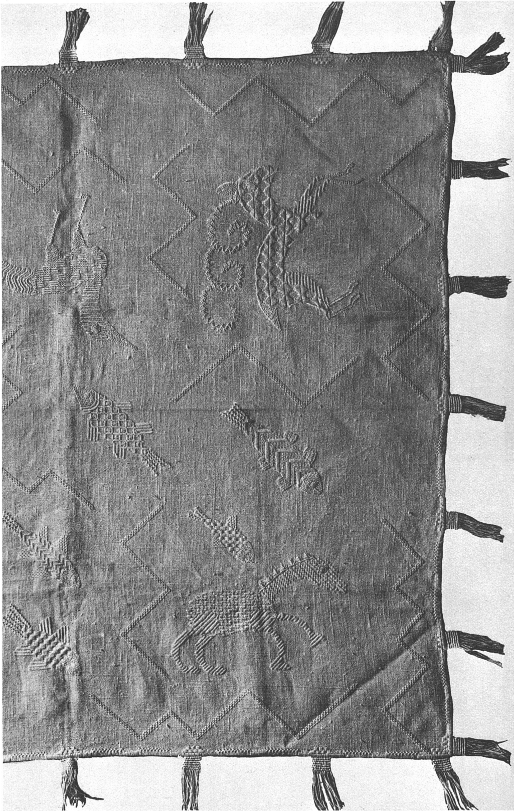
Irma Kocan SWB, Basel Tischdecke mit Leinenstickerei, Weiss auf Weiss, rechte Hälfte