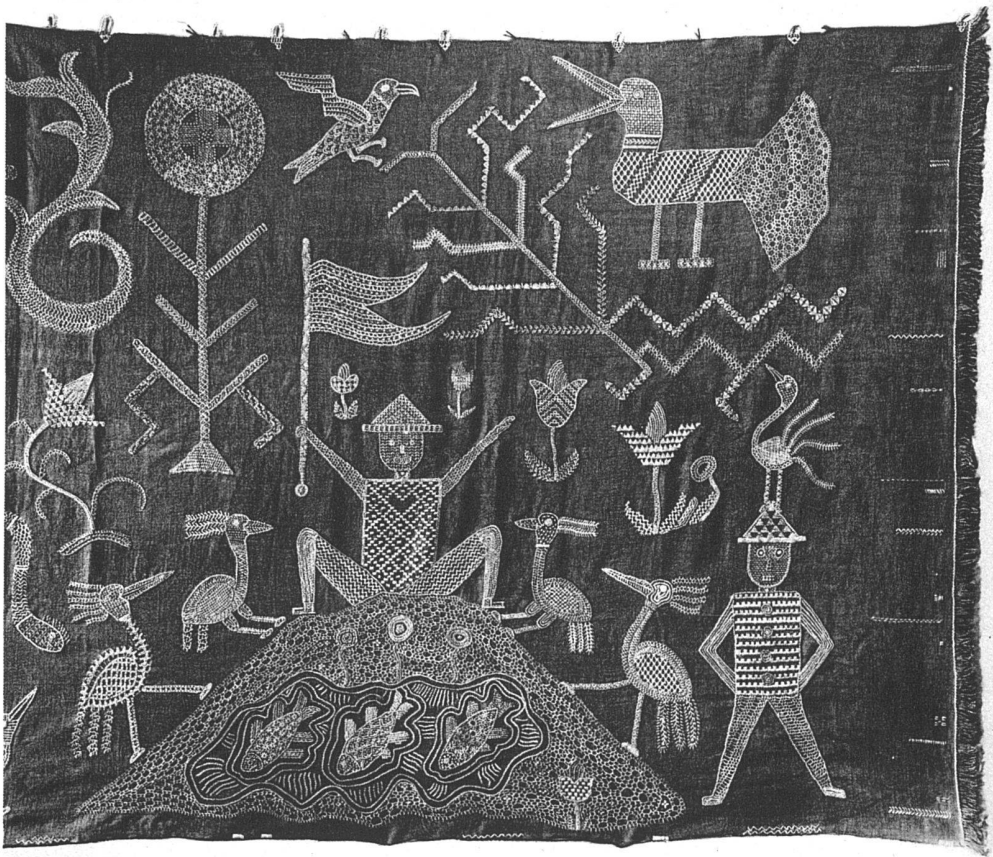
Wandbehang (85×200 cm) aus blauem Leinen mit Leinstickerei in Weiss und Beige, rechte Hälfte Irma Kocan SWB, Basel