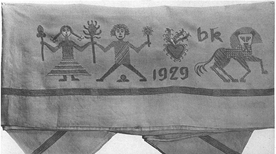
Umschlag eines Leintuchs, Leinstickerei Beige auf weissem Grund