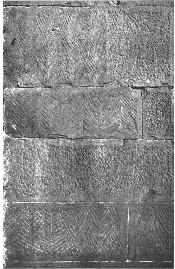
Gemustert abgespitztes Quaderwerk der Abteikirche zu Limburg an der Hardt

Aus «Die Steinbearbeitung in ihrer Entwicklung vom XI. bis zum XVIII. Jahrhundert» von Karl Friederich