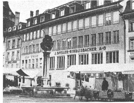
Neubauten von Trachsel und Abbühl BSA am Bärenplatz, Bern

Im Stadtkern sind soeben zwei Neubauten am Bärenplatz fertig geworden; grössere Bauten der Architekten Trachsel und Abbühl BSA, die an Stelle von einigen kleinern Altbauten in die Front zwischen Käfigturm und Bundesplatz eingebaut sind. Der breitere Bau der bekannten Kaffeewirtschaft Gfeller-Rindlisbacher ist in Eisen skelett konstruktion durchgeführt mit vorschriftsgemässer Sandsteinfassade, während der Nachbarbau «Die Sonne» in Eisenbeton erbaut wurde. Die Platzfassaden sind einfach und ruhig gehalten, bemerkenswert sind die grossen Fenster im I. Stock des grössern Baues (eine Rarität für Bern), die auf einen Wink von oben beim anstossenden Neubau unterteilt werden mussten, wohl aus Gründen der Bernerästhetik! Beide Bauten haben zwei Untergeschosse, die um je 3,50 m unter dem Trottoir vorspringen. Von dem geplanten Laubenvorbau entlang den ganzen Hausfluchten wurde bereits früher berichtet, der Entscheid steht zur Zeit noch aus. Ueber den obersten Dachausbau dieser Bauten wird noch im Zusammenhang mit andern Baufragen zu sprechen sein.