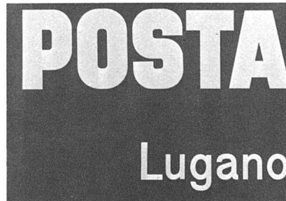
Postschilder, zwei Ausführungsentwürfe