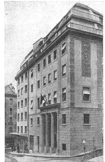
Genève la nouvelle maison de l'Armée du Salut, rue Verdaine Ed. Fatio, arch. FAS

Ces Messieurs sauront certainement voir l'avantage évident que présente le projet de loi pour l'intérêt général de notre ville.