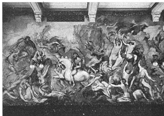
A. Soldenhoff, Teil des Wandbildes «Prometheus» Aula der Stadtschule Glarus

die verwaltungstechnische «Gleichschaltung» befohlen werden könnten.