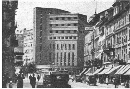
Volkshaus Biel Ed. Lanz, Architekt BSA, Biel

Zwischen dem Bahnhof und der Stadt ist unter besonderen baupolizeilichen Bedingungen ein neues Stadtviertel entstanden, das sich nunmehr durch den zehnstöckigen Neubau des Volkshauses an die bestehenden Gebäude