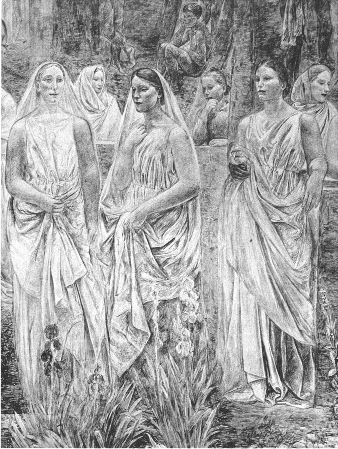
Wandgemälde (Fresko) von Paul Bodmer, Zürich, in der Aula der Universität Zürich Ausschnitt