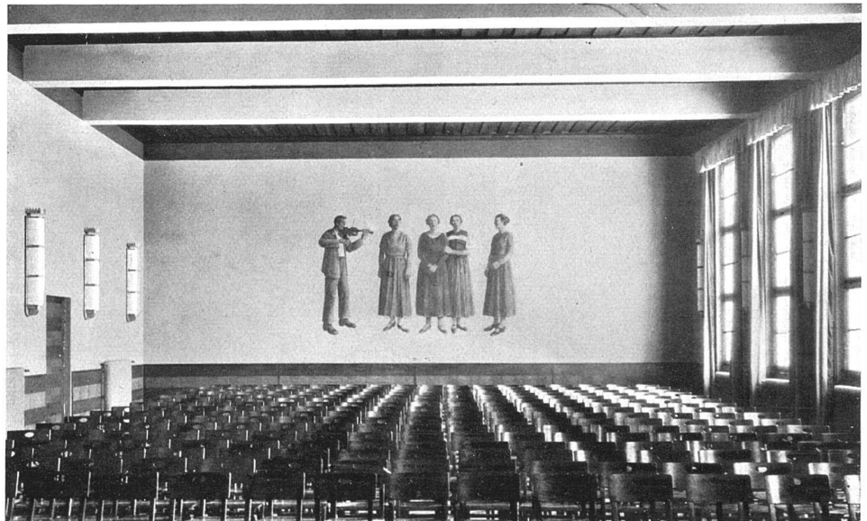
Singsaal Wandmalerei von Fred Stauffer, Bern

Dieses Schulhaus ist das Ergebnis eines im Jahr 1926 durchgeführten Wettbewerbes unter zwölf bernischen Architekten, bei dem die Firma Klauser und Streit BSA den ersten Preis erhielt.