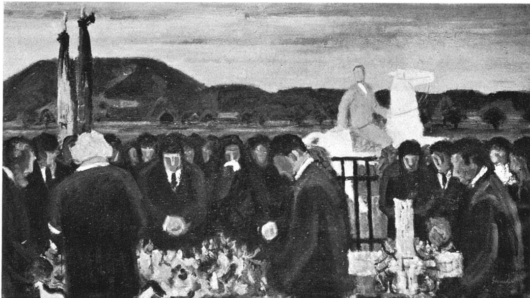
«Begräbnis mit Reiter», 1933/34, Oel, 140 × 190 cm