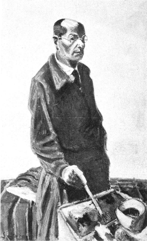
«Selbstbildnis», 1933/34, Oel, 130 × 80 cm