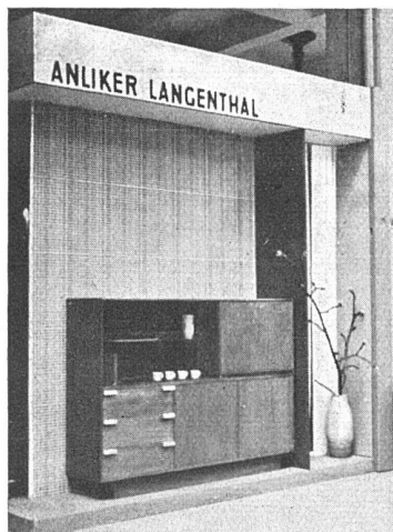
Stand einer Berner Firma. Eine der ganz wenigen Kojen mit sachlich-einfachen Möbeln an der diesjährigen Basler Mustermesse