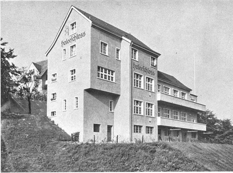
Restaurant Holeschloss bei Basel Architekt Liebetrau, Rheinfelden