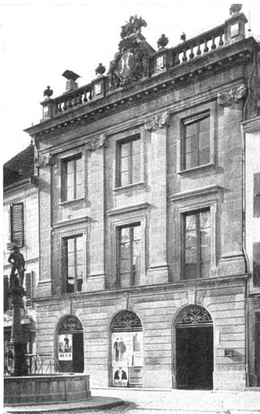
Orbe, Hôtel de Ville Façade sur la place

humanité disparue, contact le plus confus, mais le plus direct, dans les choses que cette humanité nous laisse, pénétrées de sa vie.»