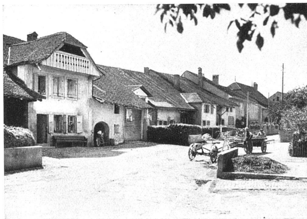
Orny, la rue

Le style français qui s'était fixé dans la pierre, à la