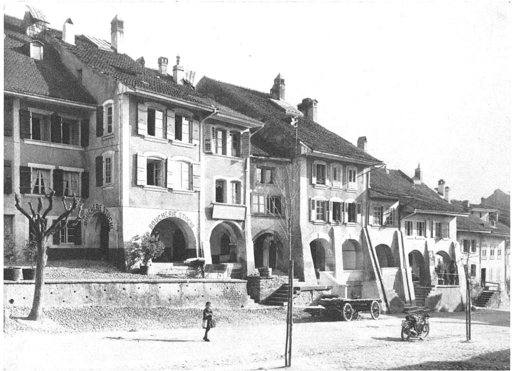
Avenches, maisons à arcades, Grand'Rue

fin du régime savoyard, à mesure que disparaissaient les constructions de bois de nos villes et bourgades, survit à ce régime. L'architecture, comme le peuple, oppose une résistance passive au conquérant. C'est une guerre d'usure, où nous voyons ce qui, de par la nature des matériaux, est le plus sujet à se détériorer dans les bâtiments: les