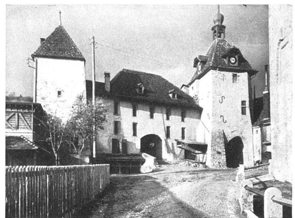
Romainmôtier, Maison de la Dîme et Tour de l'Horloge

(Spécimens d'illustrations du nouveau volume de la série «La maison bourgeoise en Suisse», vol. XXV. Le canton de Vaud, II me partie. Orell Füssli, éditeurs, Zurich. Voir «Werk» no. 4, page XXII.)