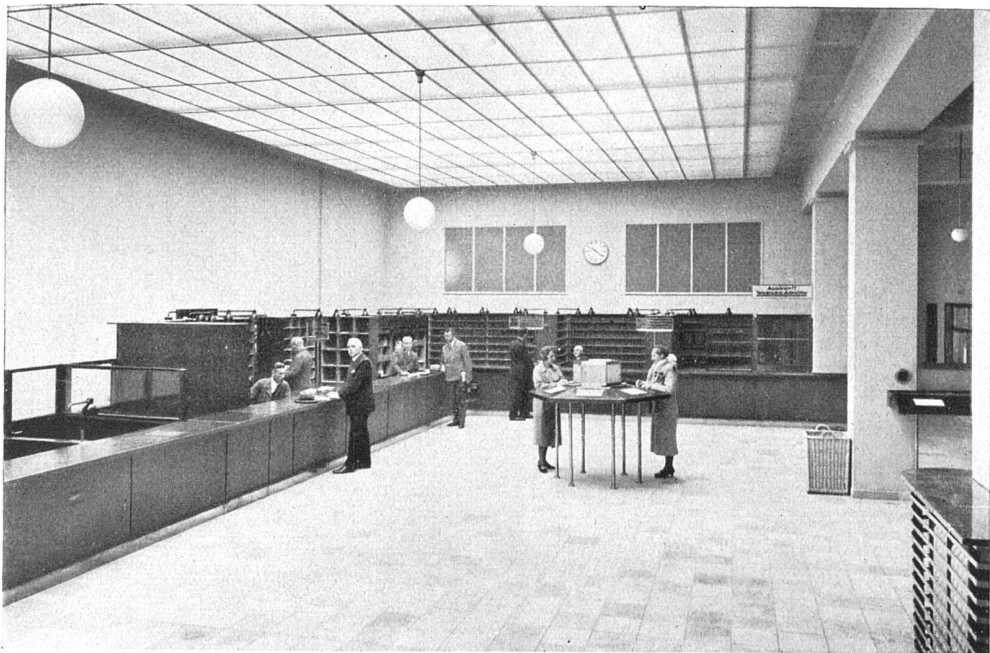
Transformation d'un hôtel des Postes à Cologne

Die neue Schalterhalle. Hier dürfte aber doch ein gewisses, sehr lobenswertes Streben nach moderner Einfachheit massgebend gewesen sein, und nicht bloss der morsche Sandstein?