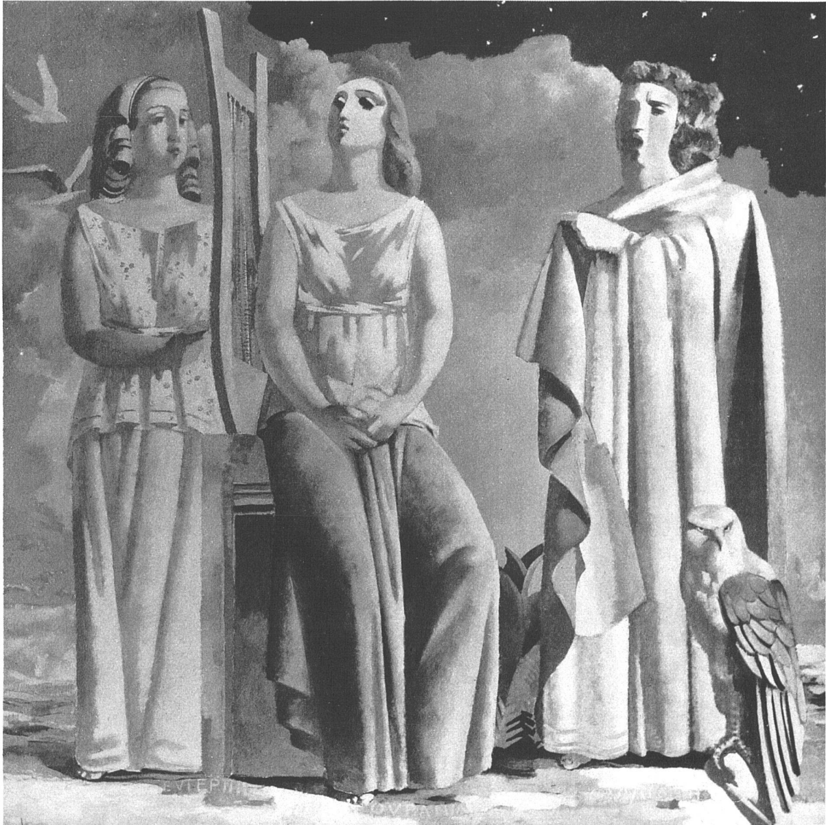
R. Th. Bossard, Peintures murales