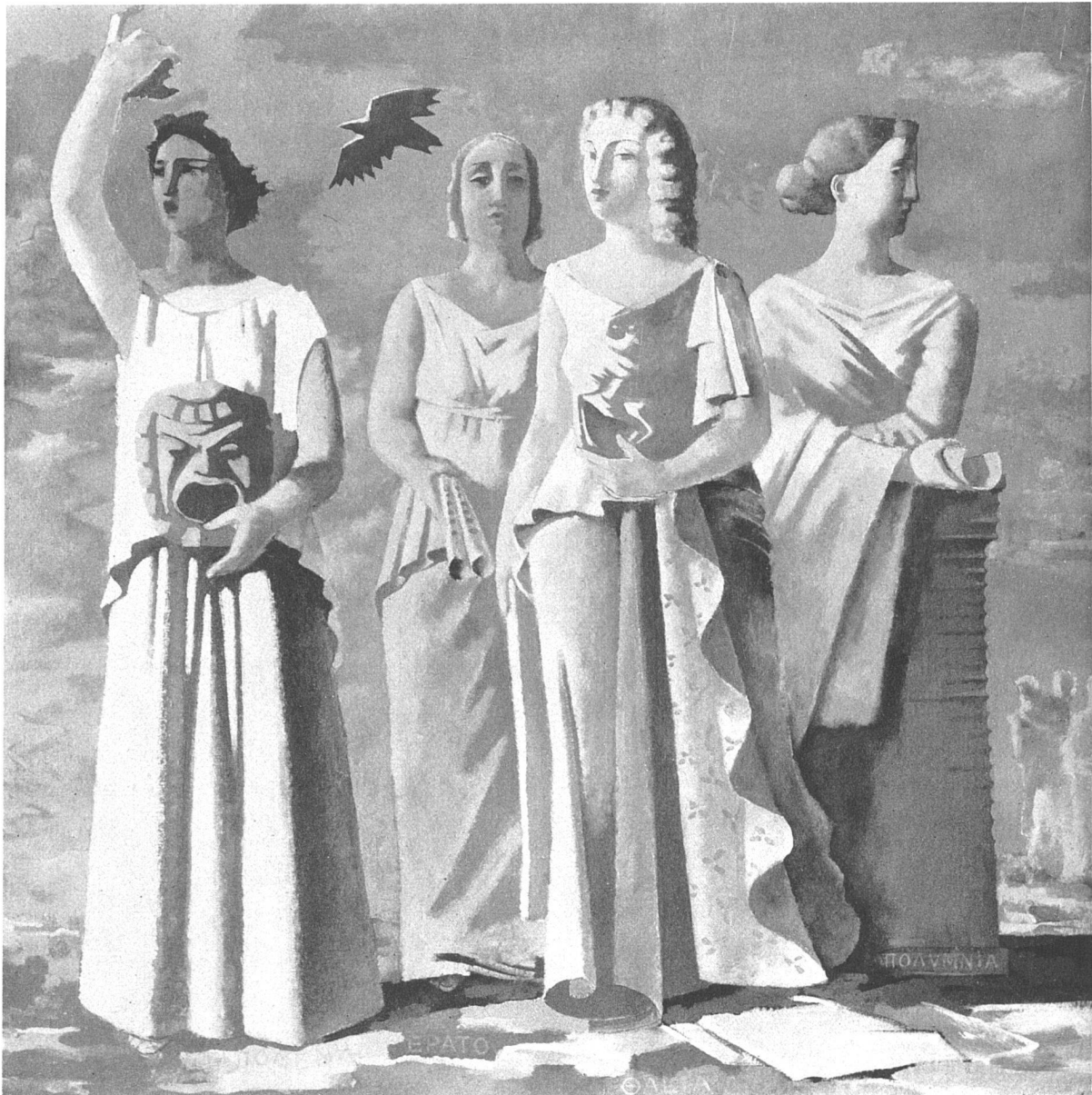
Melpomène, Erato, Thalia, Polyhymnia