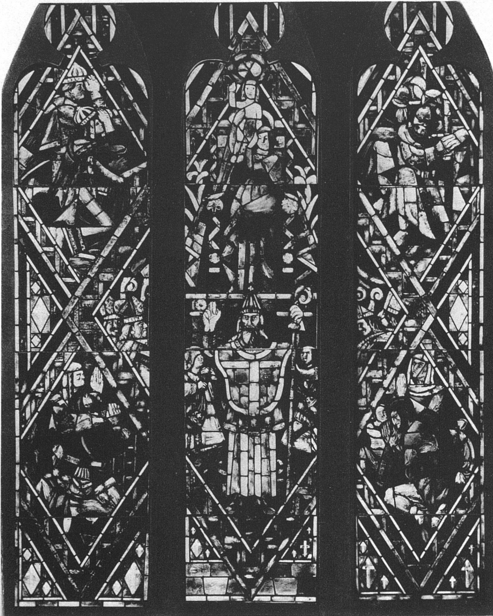
Le pape Grégoire X inaugure la nouvelle Cathédrale de Lausanne 1275

Dans son célèbre album, ce Villard de Honnecourt, qui avait «esté en moult de terres», enseigne l'art de «mesurer la largeur d'une rivière sans la passer».