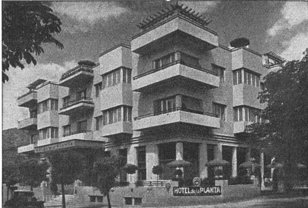
HOTEL DE LA PLANTA, SION (Valais) Architecte: A. de Kalbermatten