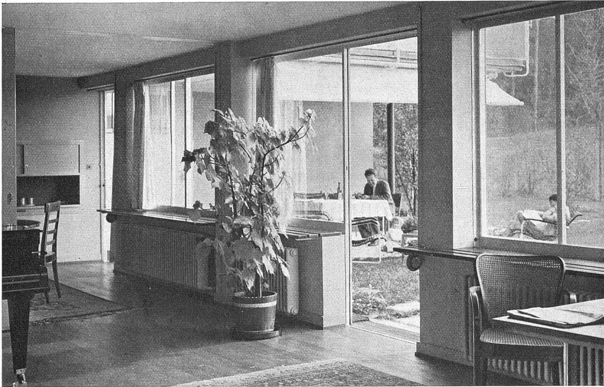
Wohnhaus in Küsnacht (Architekt Max Ernst Haefeli). — Ausführung der Metallfenster und Metalltüren:

Mechanische Schreinerei • Albisstrasse 131 • Telephon 54.290