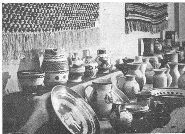
Ausstellung der Ortsgruppe Bern SWB

Das Untergeschoss enthält eine Anzahl Möbel, denen