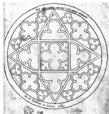
«cest une reonde ueriere de leglise de lozane» «ista est fenestra in losana ecclesia»

Die Rose im Querhaus der Kathedrale von Lausanne