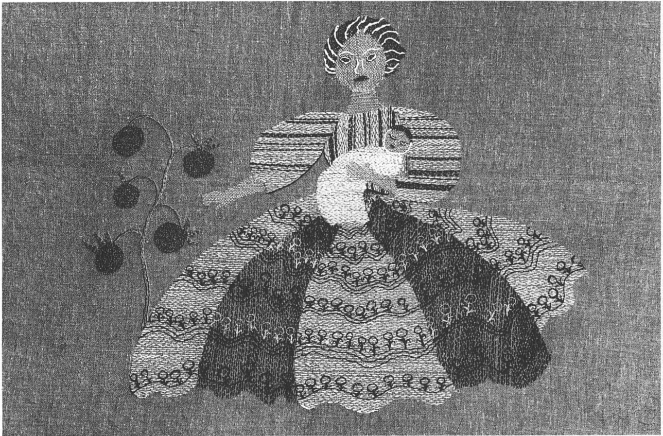
Lissy Funk-Düssel SWB, Zürich. Einzelheiten aus dem handgestickten Bettüberwurf