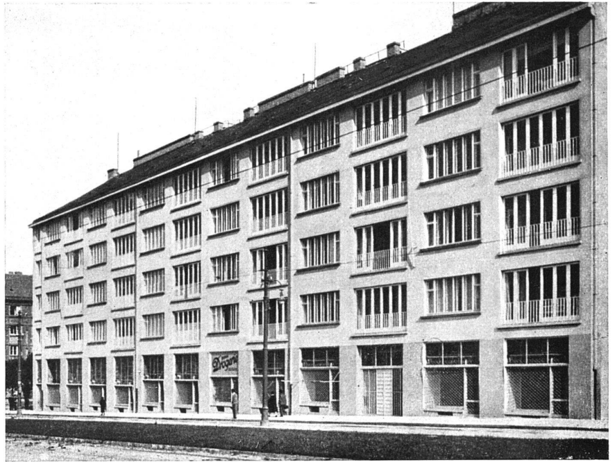
Geschäfts- und Miethäuser einer Baugenossenschaft in Prag-Dejvice Architekt Pavel Janák

An dieser Baugruppe berührt besonders sympathisch die Feingliedrigkeit der streng genormten Einzelteile. Bei durchaus moderner Haltung verderben derartige Bauten den Maßstab ihrer Umgebung nicht — hierin verwandt den ähnlich «menschlichen» schweizerischen Geschäftshausbauten dieses Heftes. (Red.)