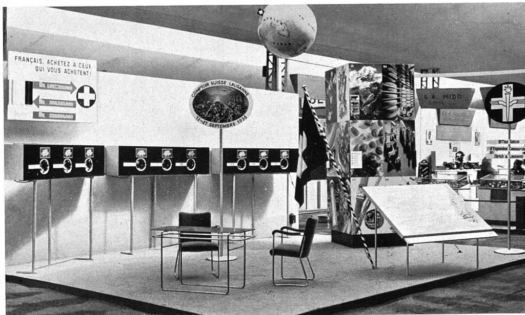
Der Stand, aufgestellt an der «Foire de Paris»