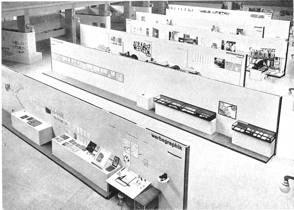
Die schrägen Stellwände