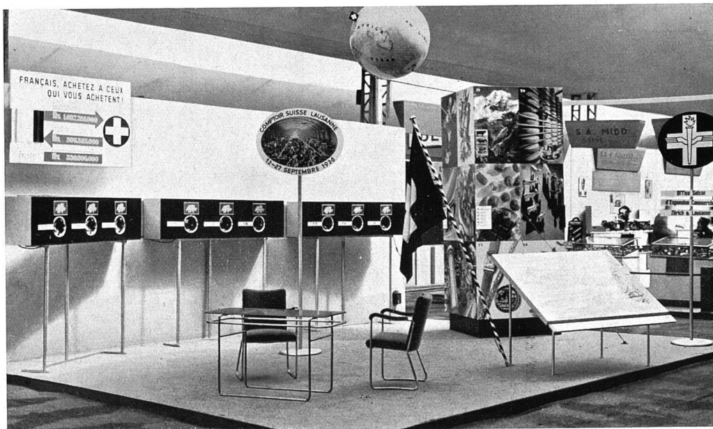
Der Stand, aufgestellt an der «Foire de Paris»