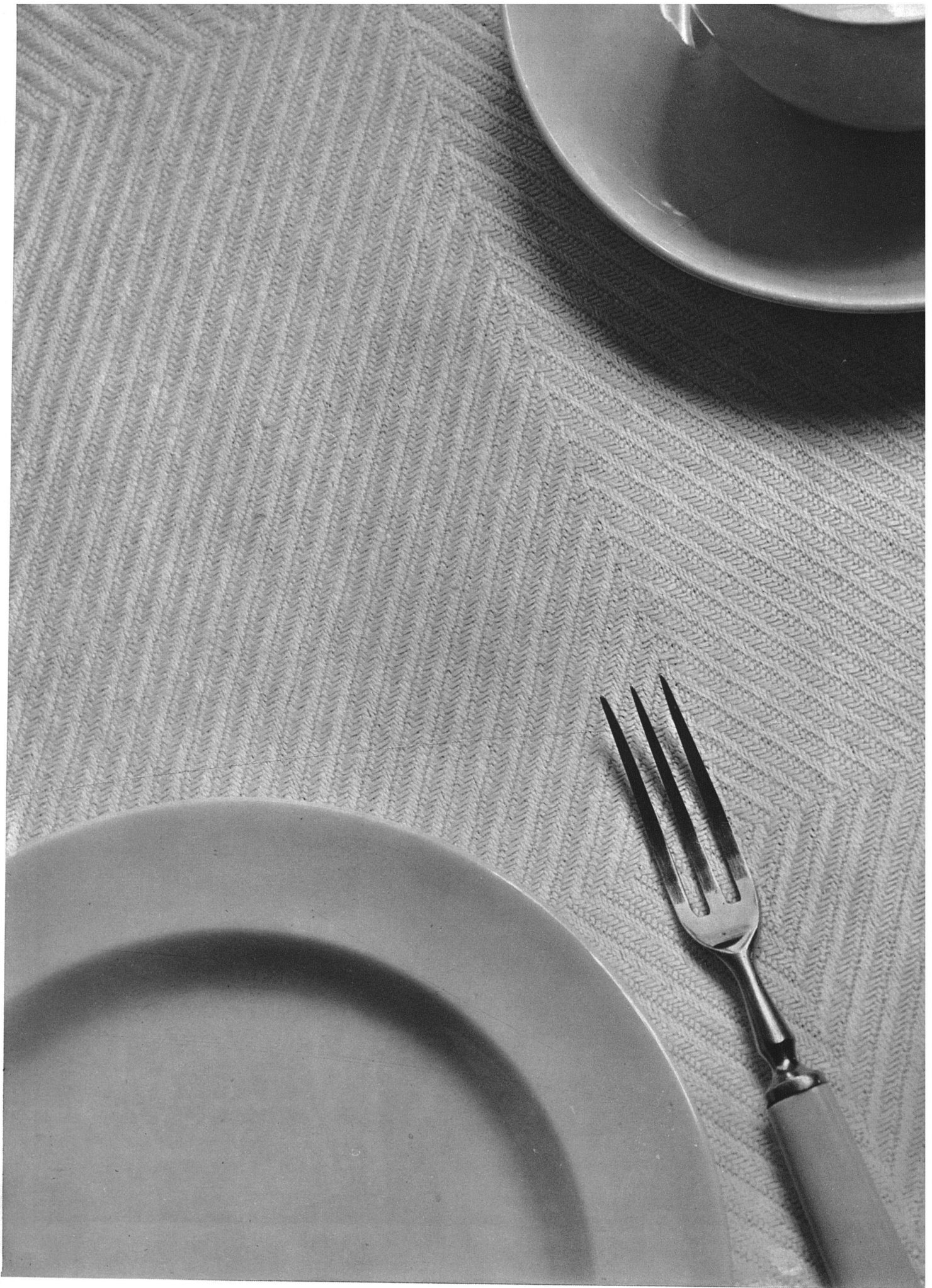
J. Pfau SWB, Winterthur. Handgewobene Tischdecke aus Leinen