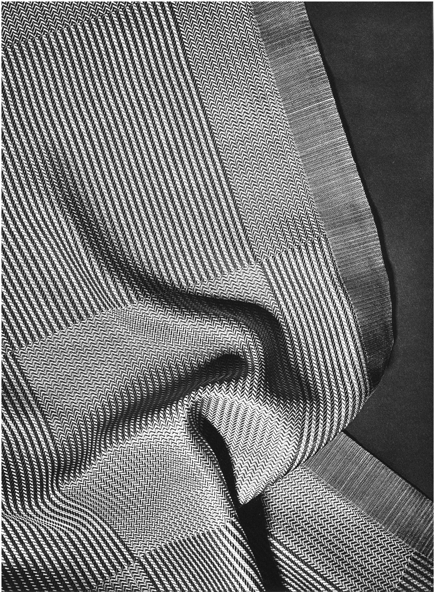
J. Pfau SWB, Winterthur. Handgewobene Decke aus Seide und Kunstseide, in Gold und Schwarz.