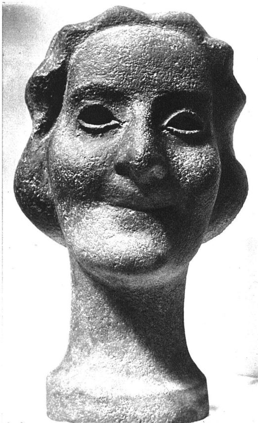
Porträtkopf, Kunststein patiniert, 30 cm