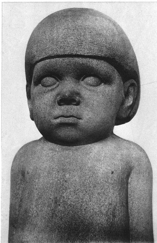
Arbeiten von W. Schwerzmann, Minusio