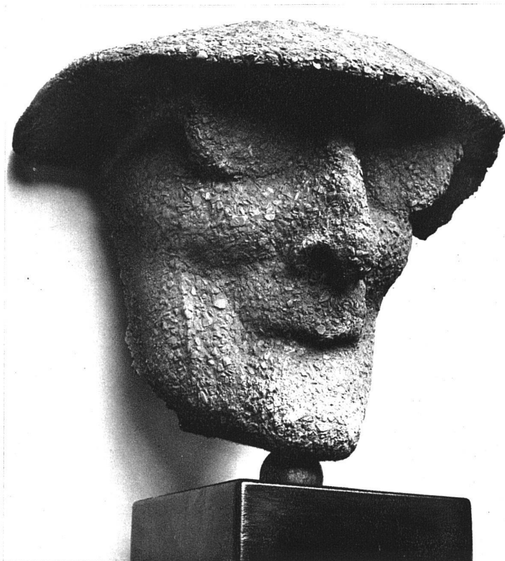
Arbeiten von W. Schwerzmann, Minusio