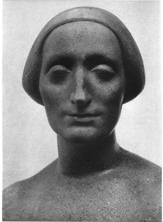
Kopf einer Figur in Steinmasse, 20 cm hoch