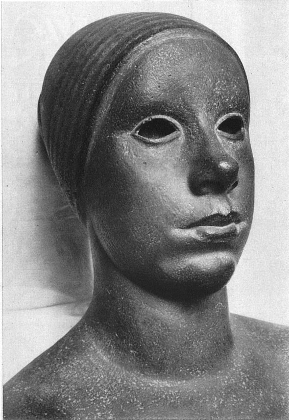
«Maria», Steinmasse, gefärbt und überarbeitet, 38 cm hoch