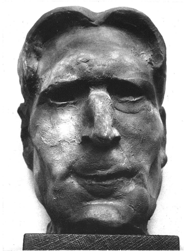
Architekt R. G., Terrakotta, 20 cm