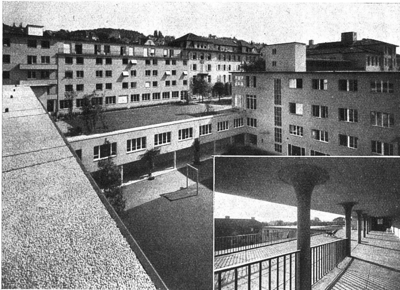
Schweizerische Pflegerinnenschule Zürich Terrassen- und Dachbeläge mit Asphalt-Gewebeplatten «Mammut» Architekten Gebr. Pfister, Zürich

Eisenwerk Klus, Klus (Solothurn) Spezialabteilung für Kunstguss Gesellschaft der Ludw. von Roll'schen Eisenwerke