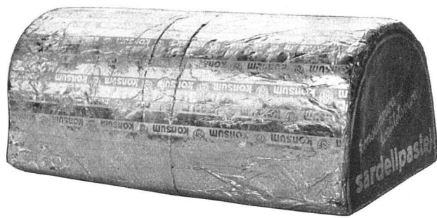
Konserven- och Lebensmittelpackungen der Kooperativen Gesellschaft. Vorbildliche Packungen: einheitlich ohne Schematismus, grafisch gepflegt, ohne kunstgewerbliche Mätzchen, von einer Modernität, die selbstverständlich und nicht gesucht wirkt.