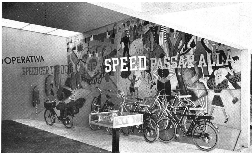
Stand der Kooperativen Gesellschaft