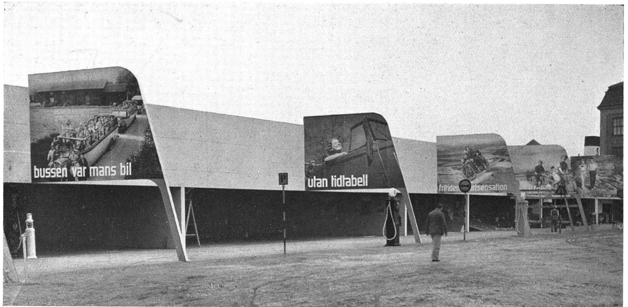
Ausstellung für die Verwendung der Freizeit, Iystad (Südschweden). Juni bis September 1936. Sport, Gymnastik, Wandern, Jugendherbergen, Volkshochschule und Heimarbeit bildeten das Programm der Ausstellung

Photomontage mit architektonischer Wirkung