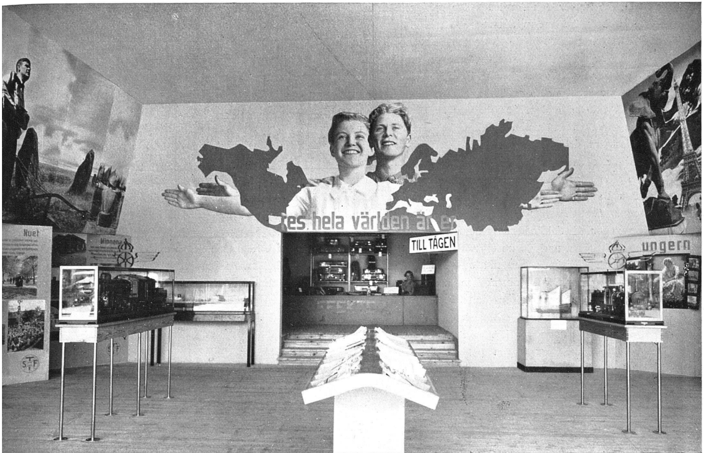
Ausstellung für die Verwendung der Freizeit, Iystad (Südschweden) 1936