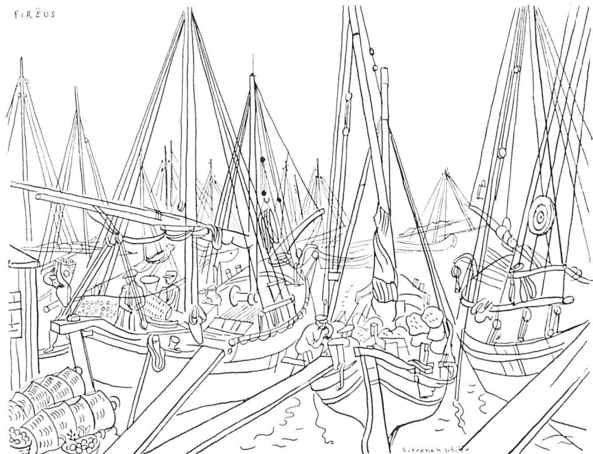
Piräus, der Hafen von Athen