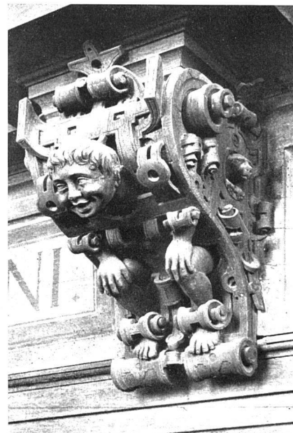
Türkonsole im Rittersaal des Schlosses Marburg

lerei in ihren Bildern erarbeitet hat, sie werden die ästhetische Seite der Architektur intensiver und mutiger in Arbeit nehmen als heute.