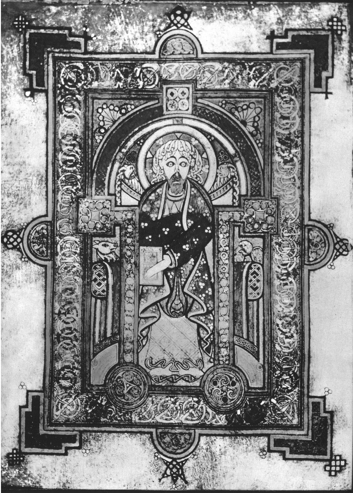
Altirisches Ornament. Frontispiz eines Evangeliums aus dem «Book of Kells» im Trinity College, Dublin

Sowohl die menschliche Figur des Evangelisten, wie auch der architektonische Zusammenhang der rahmenden Säulenarkade ist gänzlich zu Ornament zerlöst; die ursprünglich selbständigen Formbegriffe sind entkörperlicht und in das teppichartige Geflecht des Ornamentfeldes eingeschmolzen. Die Quadrate in Schulterhöhe der Figur sind die «Kapitäle», die Kreisscheiben am unteren Ende der geknickten «Schäfte» sind die «Basen» der Säulen. Man beachte