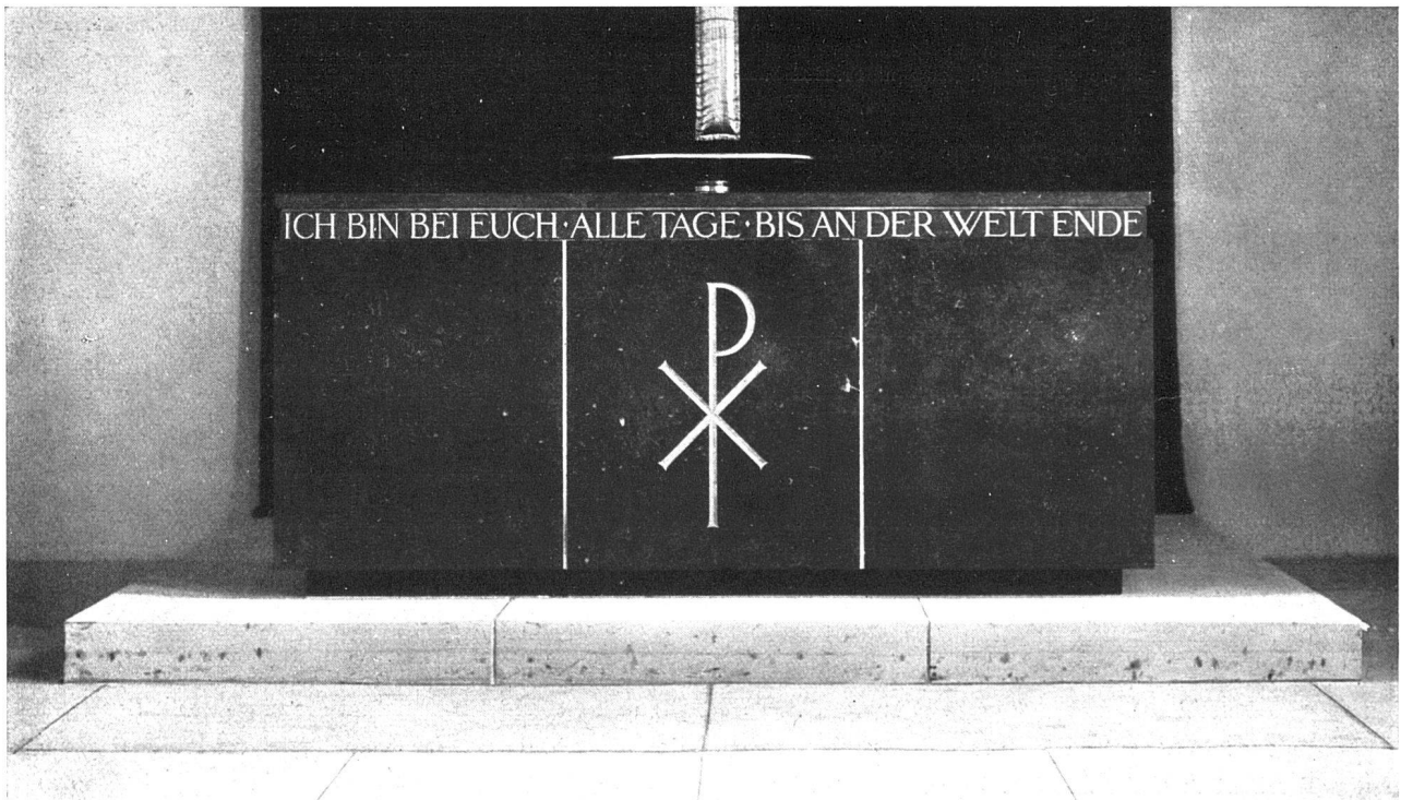
Altar (Abendmahlstisch) schwarzer, geschliffener Kalkstein, darauf die flache, silberne Schale des Taufbeckens