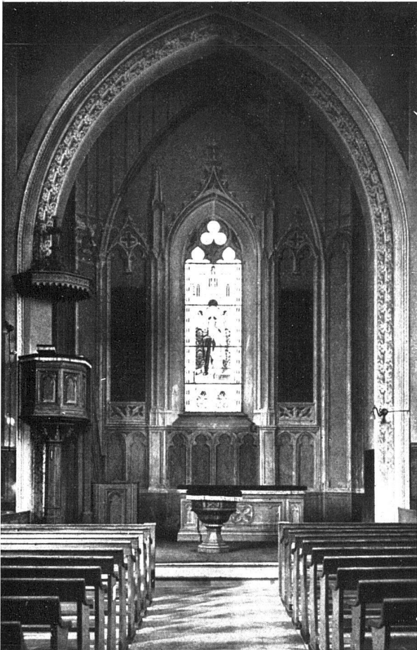
Die um 1880 in liebenswürdiger, aber spielerisch-theatermässig wirkender Neugotik errichtete Kirche vor dem Umbau Die gotischen Architekturglieder sind nur aufgemalt