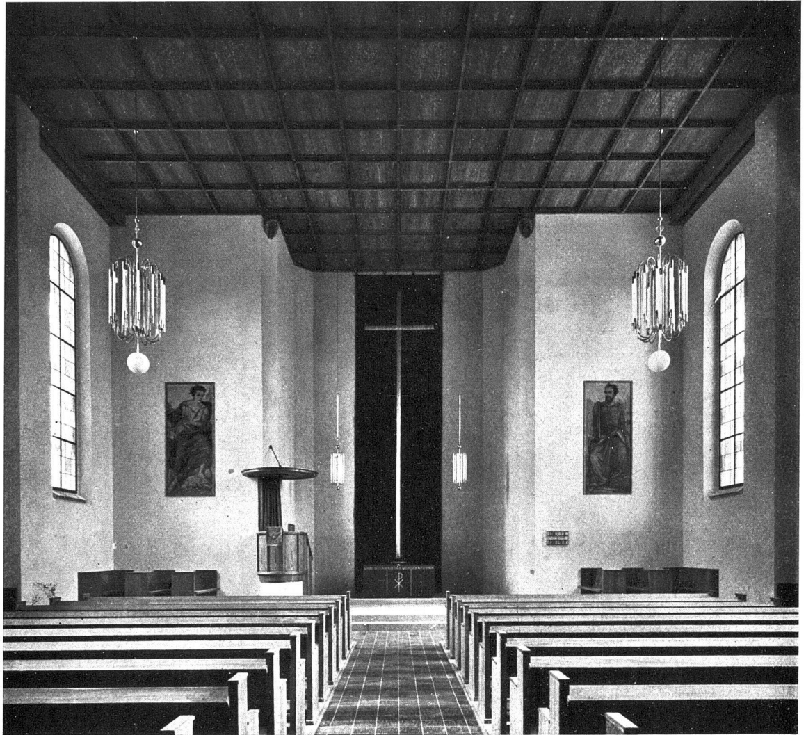
Umbau der evang. Landkirche in Obfelden (Kt. Zürich), 1933 Architekt A. H. Steiner BSA, Zürich Die ohne «Triumphbogen» schlicht in die Chornische hineingeführte Decke, Bestuhlung und Kanzel sind in ungestrichenem Berglärchenholz erstellt. Altar in schwarzem geschliffenem Kalkstein, dahinter dunkelroter Seidenvelour-Vorhang mit silbernem Kreuz. Umbaukosten rund Fr. 110 000.