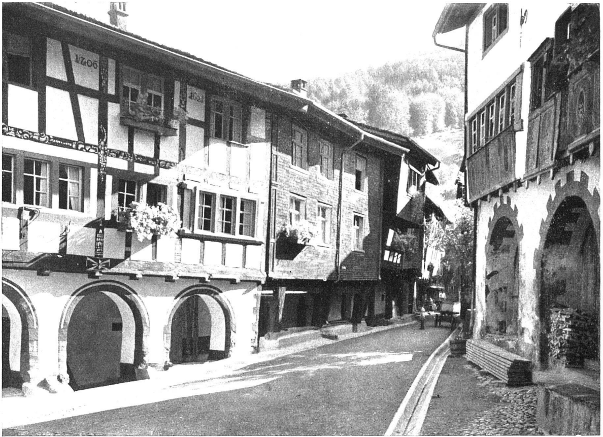
Werdenberg, Hauptstrasse. In dieser Art hat man sich die Strassen auch der grössten Städte noch des XIV. Jahrhunderts vorzustellen

«Das Bürgerhaus in der Schweiz», Band XXIX, Kanton St. Gallen, II. Teil Seite 381 oben: Stadt und Schloss Rapperswil am Zürichsee, gegründet Anfang des XIII. Jahrhunderts unten: Städtchen und Schloss Werdenberg im St. Galler Rheintal