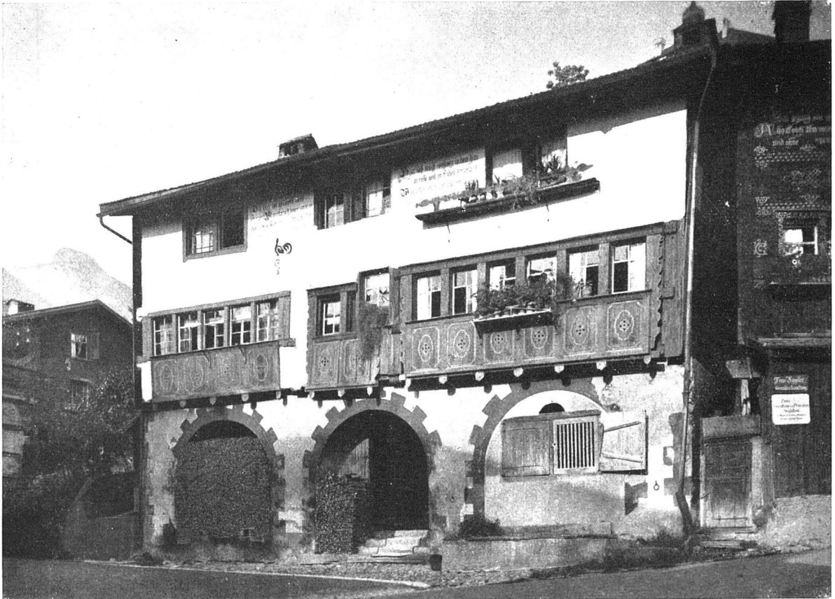
Werdenberg. Durch die Estriche der Häuser führt ein alter Wehrgang Das Städtchen ist in den Anfängen steckengeblieben und besitzt weder Kirche noch öffentlichen Brunnen

«Das Bürgerhaus in der Schweiz», Band XXIX, Kanton St. Gallen, II. Teil Seite 381 oben: Stadt und Schloss Rapperswil am Zürichsee, gegründet Anfang des XIII. Jahrhunderts unten: Städtchen und Schloss Werdenberg im St. Galler Rheintal