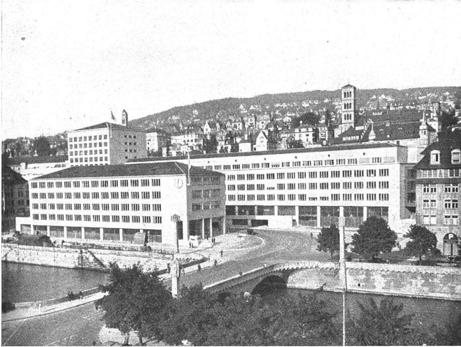
Kantonale Verwaltungsgebäude (Walchebauten) in Zürich. Architekten Gebrüder Pfister, Zürich. Für die Heizungsanlage dieser Gebäude wurden ZENT-Radiatoren «MODERN» verwendet

Der verantwortungsbewusste Architekt verwendet mit Vorliebe ZENT-Heizkessel, -Radiatoren, -Elektroboiler. Sie sind konstruktiv durchdacht und qualitativ erstklassig