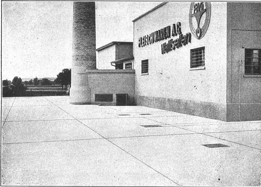
Ausführung von Kieserling Spezialbeton «Durocret» Duratexbeton Egypto farbig