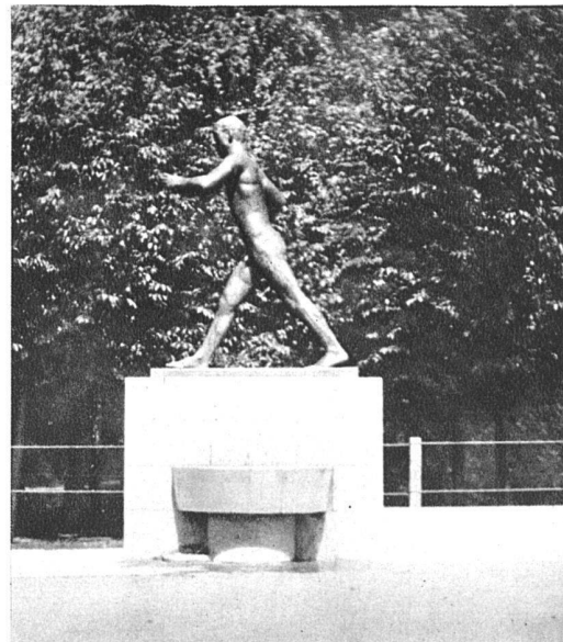
Der «Läufer» auf der Spielwiese Zürich-Oerlikon Gesamtansicht