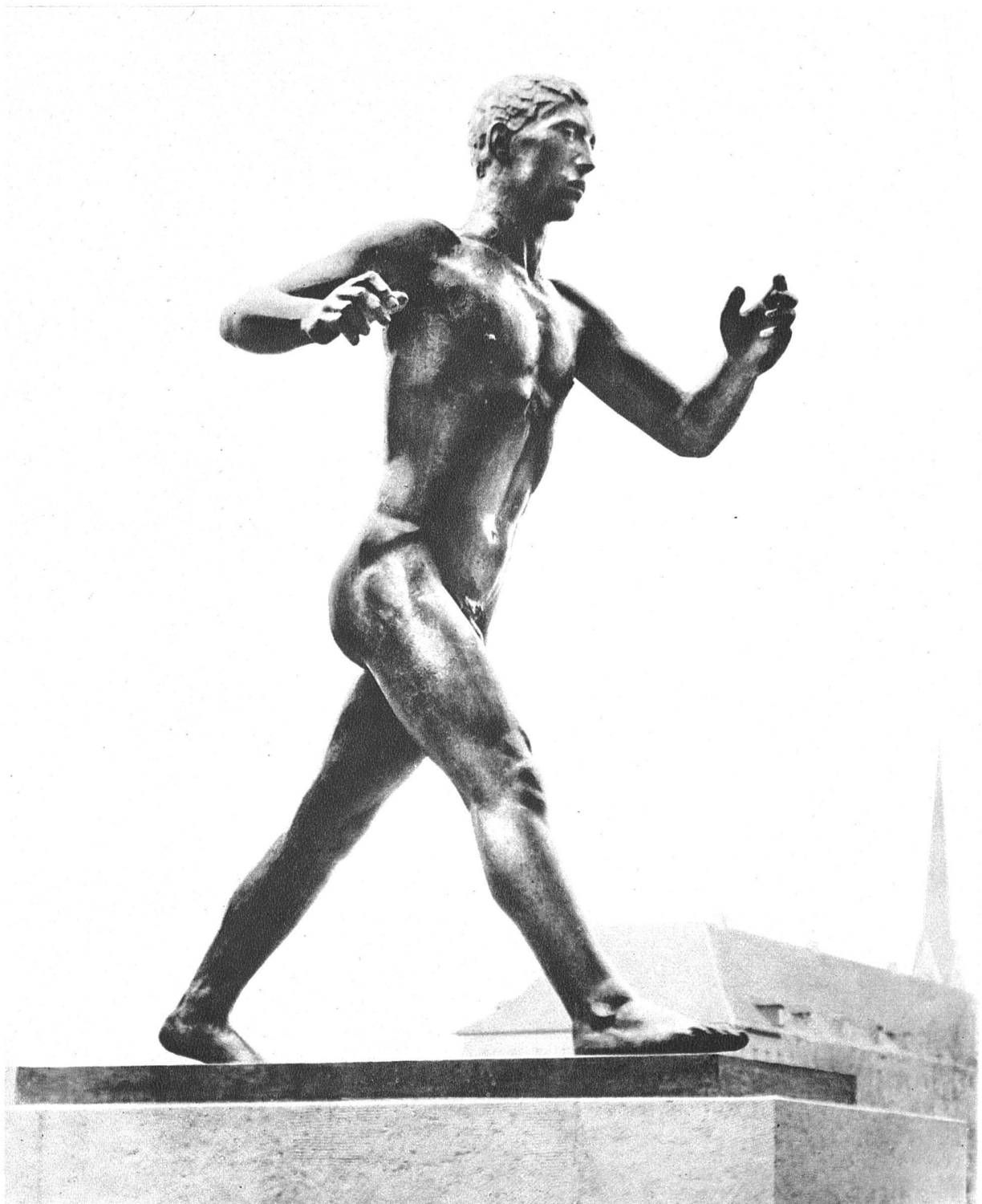
Franz Fischer SWB, Zürich-Oerlikon «Läufer», Bronzefigur in anderthalbfacher Lebensgrösse auf der Spielwiese Oerlikon. Sockel in Laufener Kalkstein Städtischer Auftrag 1934, vollendet 1937. Bronzeguss Jaeckle, Zürich-Seebach