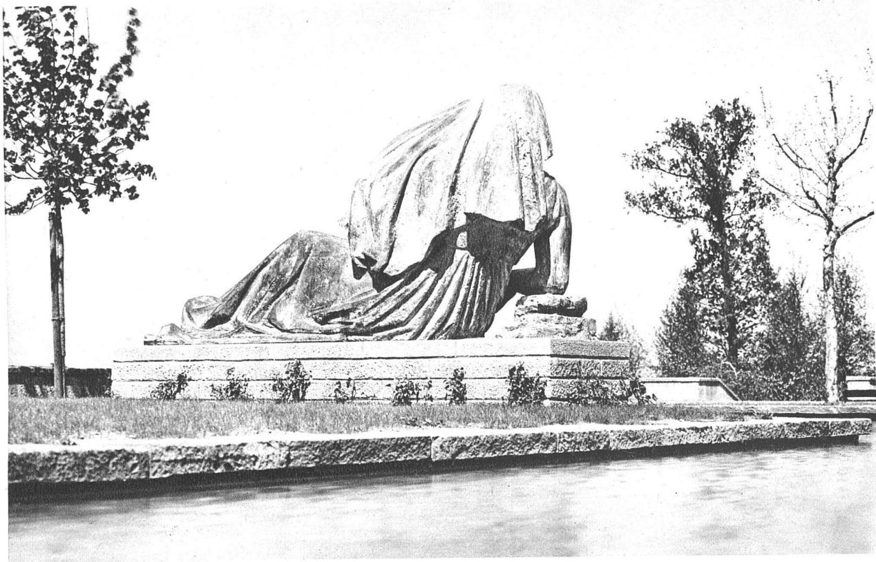
Franz Fischer SWB, Zürich-Oerlikon Figur im Friedhof Enzenbühl, Zürich. Bronze, doppelte Lebensgrösse, Sockel in Granit Städtischer Auftrag 1936, vollendet 1938. Guss Jaeckle, Zürich-Seebach