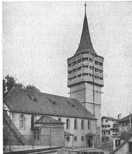
rechts: Kirche St. Peter Zürich

Vertreter in allen grösseren Kantonen • Mietweise Erstellung für Neu- und Umbauten durch