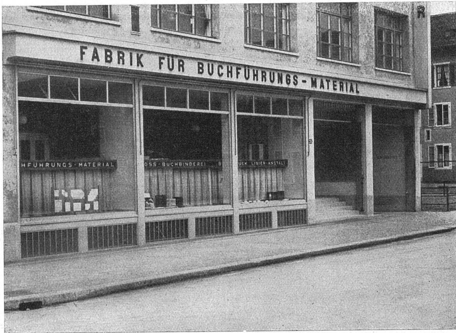
Geschäftshaus Paul Carpentier Söhne, Zürich. Architekten: Debrunner & Blankart, Zürich

Schaufensteranlagen in Eisen, Bronze und Anticorodal. Scherengitter. Sonnenstorenanlagen