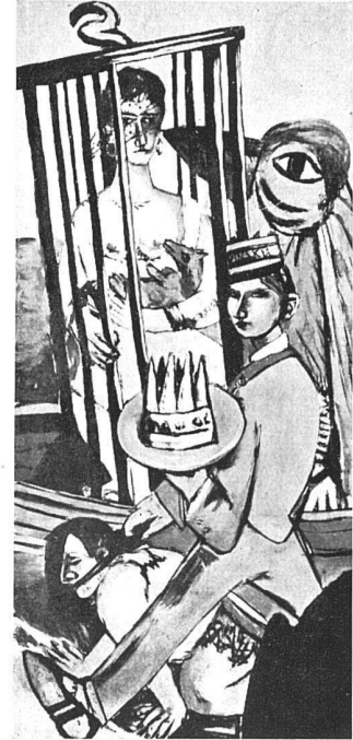
Max Beckmann. Triptychon «Versuchung», 1937

Hervorragende Gestalter wie den späten Lovis Corinth und Oskar Kokoschka; Ideen und Einflüsse des Bauhauskreises, die Experimente des Surrealismus und die wenigen Versuche eines deutschen Konstruktivismus. Wir hatten an dieser Stelle aus Anlass der Ausstellungen zweier deutscher Maler in der Schweiz, am Werk von Dix und Beckmann, die Entwicklung zu illustrieren versucht. Von den speziellen Standorten dieser Künstler zum allgemeinen Standort der deutschen Kunst unserer Zeit kommend, ergeben sich die Schlüsse, dass der Expressionismus Ausdruck einer sozialen und kulturellen Situation war. Seine polemische Intransigenz scheint überwunden, und die ihm eigentümlichen Errungenschaften sind aufgegangen in das Bewusstseinsgut der Zeiten. Wohin es weiter geht, ist kaum mit prophetischer Gewissheit zu sagen. Der Weg der Kunst ist nicht selbständig und ausserhalb der gesellschaftlichen Wirklichkeit vorstellbar. Nicht wohin die Kunst geht, sondern wohin die Menschheit sich wendet, ist die bange Frage. Auf keinen Fall —