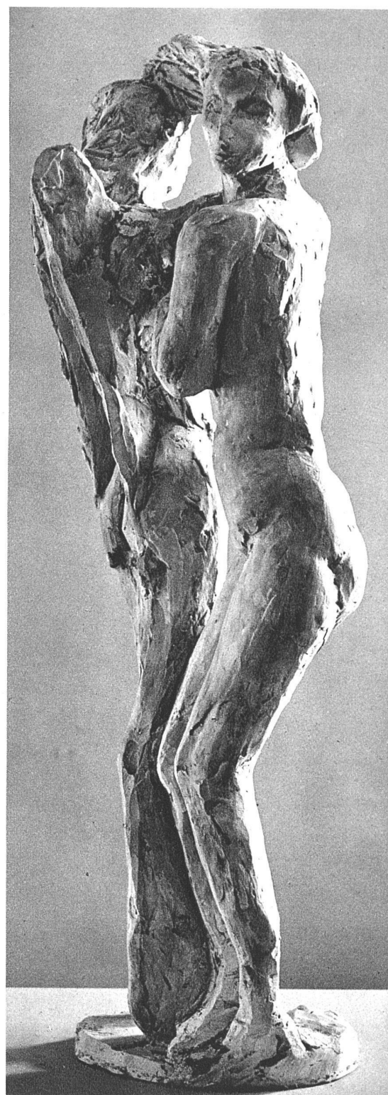
Paul Speck, Zürich. Mädchen und Engel, Gips, 57 cm hoch

Zur Zeit hat Bildhauer Paul Speck ein grosses Relief aus weisser Fayence vollendet für einen Seitenaltar der von Architekt Fritz Metzger BSA erbauten St.-Karls-Kirche in Luzern. Die Platte misst 265×175 cm, vor dem Reliefgrund stehen fast vollrunde lebensgrosse Figuren. Nun muss diese Reliefgruppe noch gebrannt werden; wir werden die sehr bemerkenswerte Arbeit später im «Werk» veröffentlichen. Die hier abgebildete Gruppe «Mädchen mit Engel» zeigt, dass der Künstler das besondere Talent besitzt, ein religiöses Thema in offener, moderner Auffassung vorzutragen, ohne in jene geschmäckerlich-historisierenden Anlehnungen zu verfallen, die selbst artistisch geschickten Arbeiten religiöser Kunst heute so