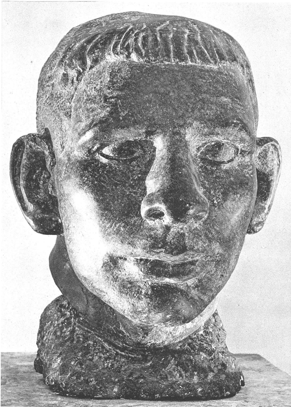
Paul Speck, Zürich. Knabekopf aus Diabas, 35 cm hoch