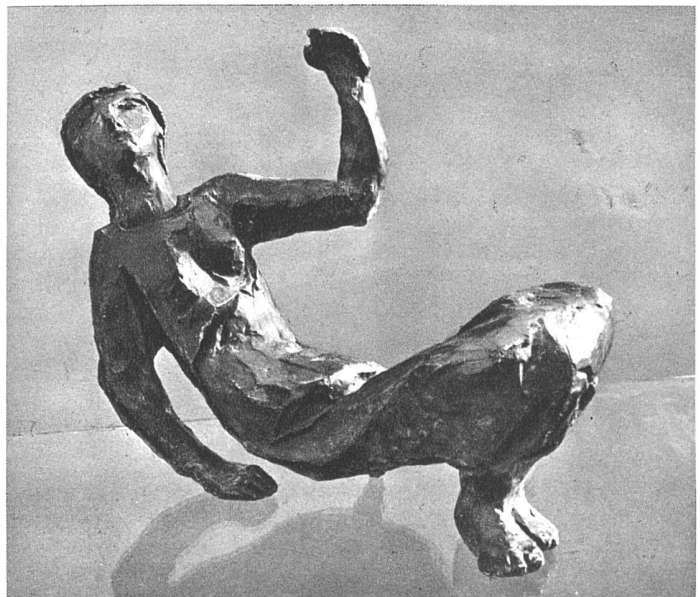
Paul Speck, Zürich Figur in schwarzer Bronze 40 cm lang

den beiden Diktaturstaaten sich nicht ohne einen gewissen programmatischen Krampf abwickelt, was der künstlerischen Qualität selten zu statten kommt, tritt es in Paris in einer sozusagen freiwilligen und freundlichen Form auf, nicht befohlen, sondern einfach darum, weil es im Laufe der geistigen Entwicklung wieder einmal an der Tagesordnung ist. Das Pariser Museum verdient alles Interesse, denn es sucht mit einfachen und architek-