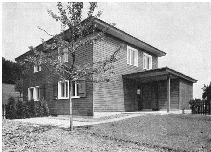
Südostecke, rechts Schopf und Sitzplatz Zweifamilienhaus in Holzbau, Typ B der Grundrisse Seite 56

Siedlungen aus Holzhäusern Musterhaus der Holzhausiedlung Bruggwaldstrasse, St. Gallen Erbaut April/Mai 1937