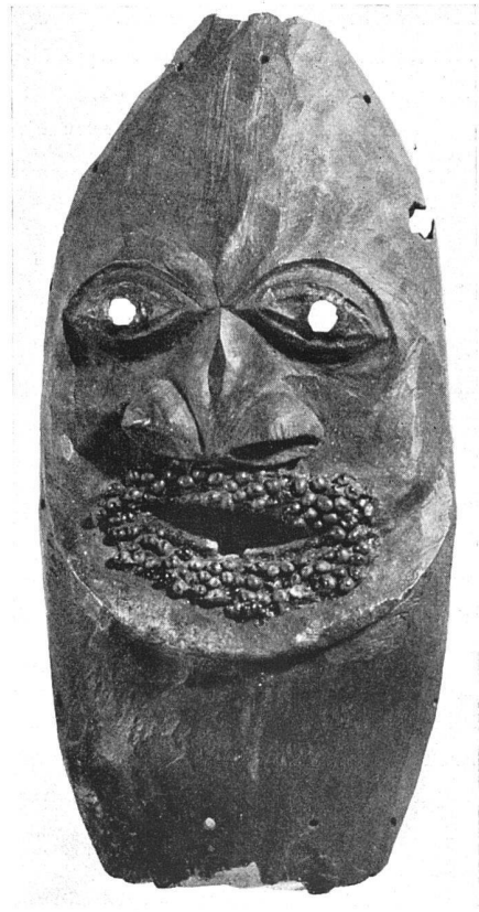
Holzmaske aus Neu-Caledonien