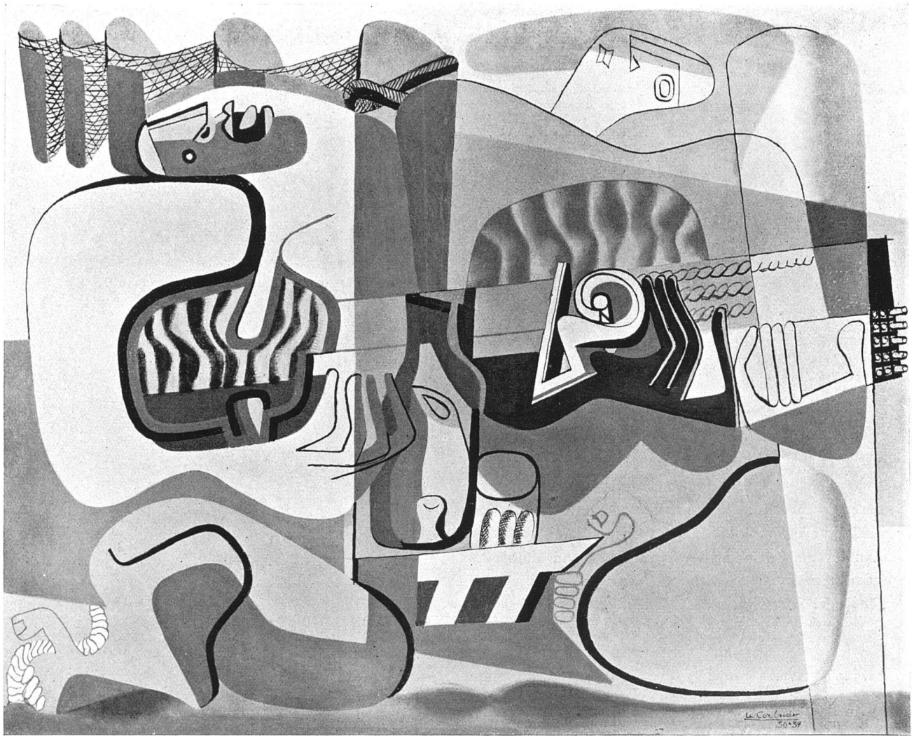
Le Corbusier, «Deux musiciennes au violon et à la guitare», 1937, 162 × 130 cm. Aus der Ausstellung im Kunsthaus Zürich