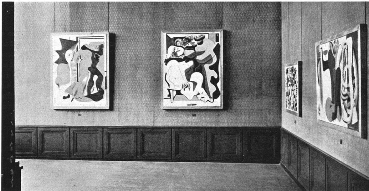
Ausstellung Le Corbusier — Tableaux et architecture — im Kunsthaus Zürich, Januar 1938

etwas auszusagen und inhaltlich festzulegen. Also ungefähr wie man ein Stück schönfarbigen Stoff oder einen apart geformten Naturgegenstand an die Wand hängt oder aufstellt. Irgendein Natureindruck oder eine innere Vorstellung gibt das Stichwort für freie Umschreibungen, die die formal wirksamen Elemente nach Belieben ausziehen und für sich allein verwenden — das ergibt Arabesken mit einzelnen Realitätsreminiszenzen, wobei nicht die künstlerische Gesetzmässigkeit im Bereich der Wirklichkeitsformen aufgezeigt wird, was das vielleicht verdienstlichere, aber sehr viel schwierigere Unternehmen wäre, sondern diese Wirklichkeitsformen verdampfen im Unverbindlichen, rein Dekorativen.