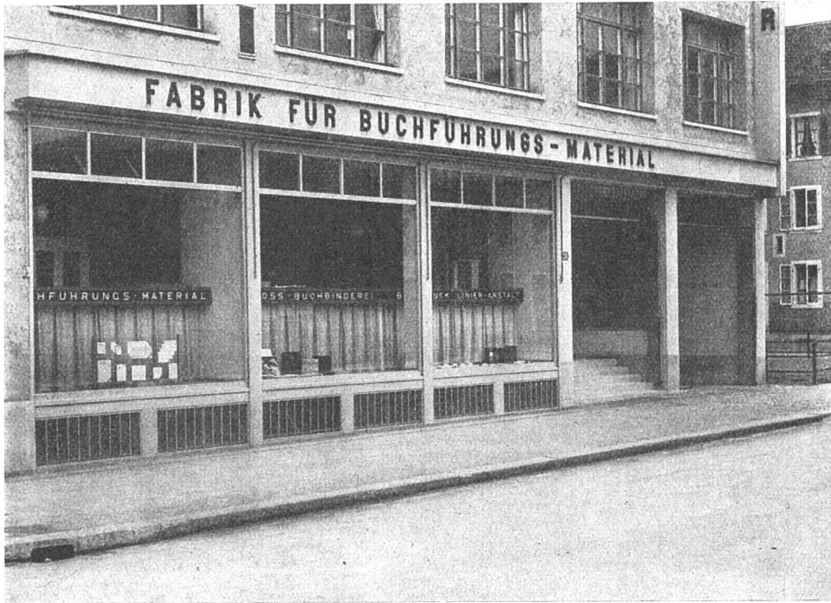
Geschäftshaus Paul Carpentier Söhne, Zürich. Architekten: Debrunner & Blankart, Zürich

Schaufensteranlagen in Eisen, Bronze und Anticorodal. Scherengitter. Sonnenstorenanlagen